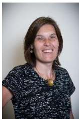
An Desmet Hoofd International Office

an.desmet@ugent.be Blandijnberg 2 bureau 05.03.100.041